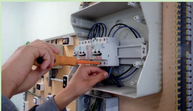
Figura: OPERATORE ELETTRICO

L'Operatore elettrico interviene nel processo di realizzazione dell'impianto elettrico con autonomia e responsabilità. La qualificazione acquisita consente di svolgere attività di installazione e di manutenzione di impianti elettrici civili nelle abitazioni residenziali, negli uffici e negli ambienti produttivi nel rispetto delle norme di sicurezza. L'Operatore elettrico pianifica e organizza il proprio lavoro seguendo le specifiche progettuali, occupandosi della posa delle canalizzazioni, del cablaggio, della preparazione del quadro elettrico, della verifica e della manutenzione dell'impianto.